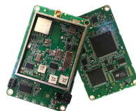
收发模块 (9.6x1.3x4.8cm, 50g)

网管软件。 实现空中远程设置系统内其他电台参数如串口格式、发射功率、工作频率等，也可以实现空中远程监测系统内其他电台状态如工作电压、工作温度、接收信号强度、信噪比、误码率、状态告警等。