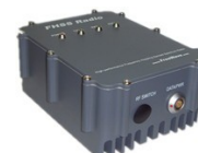
SDL Base 25 瓦大功率基准站