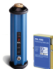
PDL Rover 单收流动站