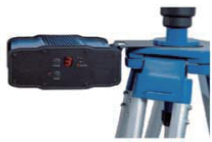
PDL 35 瓦大功率基准站电台