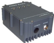
SDL 25 瓦大功率基准站电台