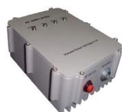
25 瓦 / 35 瓦 / 45 瓦 外置功放

PDL35W/ADL45W/SDL25W 大功率基准站电台为野外测量 (Surveying)、精准定位 (Precise Positioning) 等作业的全球导航卫星系统 (Global Navigation Satellite System)/ 动态实时差分 (Real-time Kinematic) 提供高速、远距离、抗干扰的无线数据链 (Wireless Data Link)。电台结构坚固紧凑、重量轻、高效省电。无论环境多么恶劣，电台操作简单、性能稳定、工作可靠。电台为安装到三角架或平行杆独特设计并提供各种连接线、充电器、便携箱等附件。