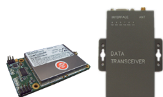
TRH (7 瓦收发模块)