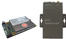
TRH 7 瓦收发模块 / 整机 (异步 232)