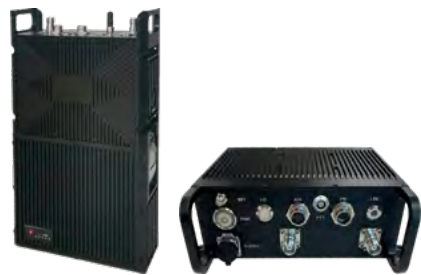
背负 / 车载

22.9x18.9x6.2cm/3.86kg, 18.3x15.4x6.3cm/1.56kg (10 瓦 ×2/20 瓦 ×2)