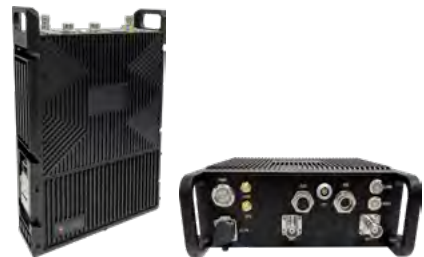
背负 / 车载 (10 瓦 ×2/20 瓦 ×2)