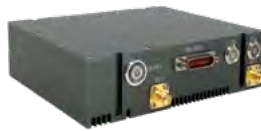
(空地 150~300/250~500 公里)