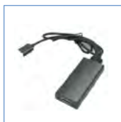
USB 转 IP