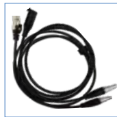
雷莫头 IP 线 雷莫头 USB 线