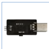
USB 转 S bus