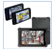
WiFi PAD (6 寸 / 8 寸)