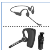
骨传导耳机、蓝牙耳机