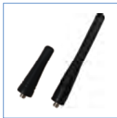
双频高灵敏度天线