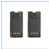
主备电池 (6.8Ah 锂聚合物电池)